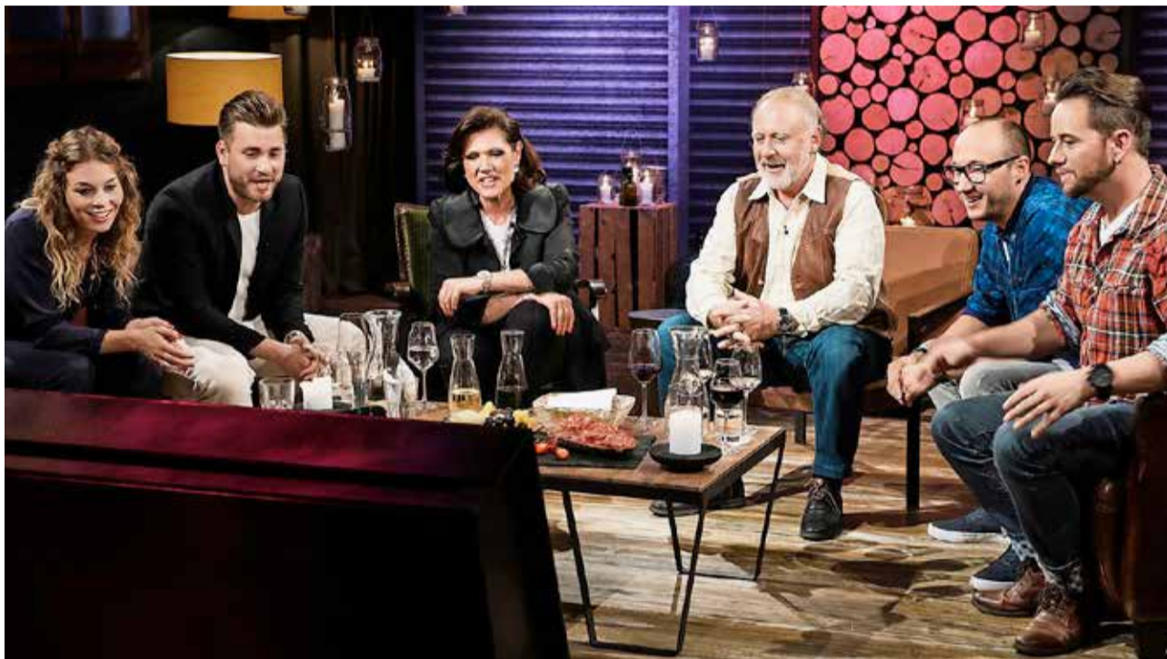
In der wohligen Atmosphäre der Murger «Sagibeiz»: Anna Rossinelli, Baschi, Maja Brunner, Peter Reber, Ritschi und Trauffer (von links) bei der Aufzeichnung von «100 % Schweizer Musik».

Natürlich schwingt Nostalgie mit. Die zahlreichen Einspielungen mit Auftritten von Peter, Sue & Marc, die viermal am Eurovision Song Contest die Schweiz vertreten haben, sowie den Querweisen zu anderen Künstlern, die mit Songs von Peter Reber Erfolg